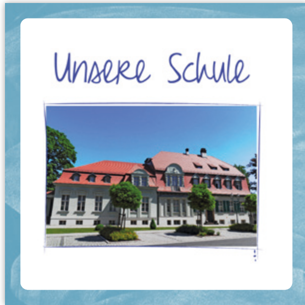
Seite mit Beispiel-Foto