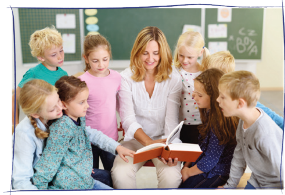
Klasse 4a der Albert Schweitzer Grundschule