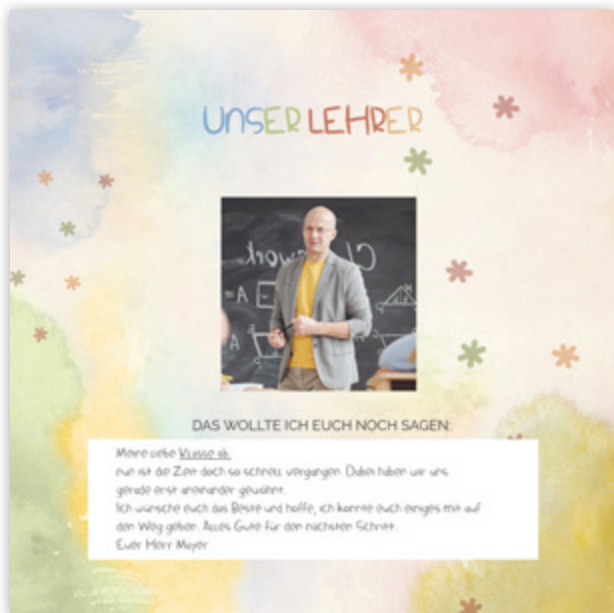
Seite mit Beispiel-Eintrag