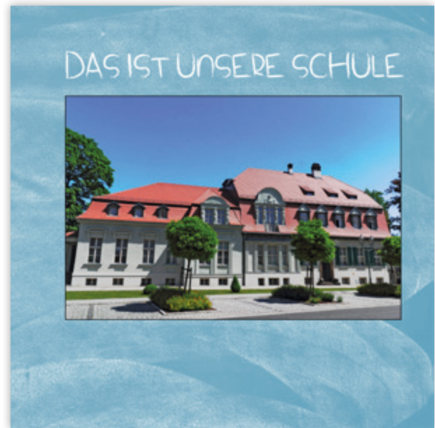
Seite mit Beispiel-Foto