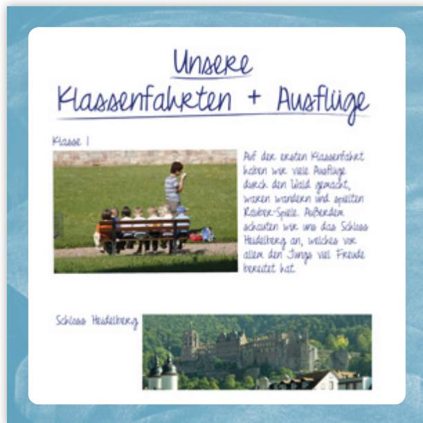
Seite mit Beispiel-Eintrag